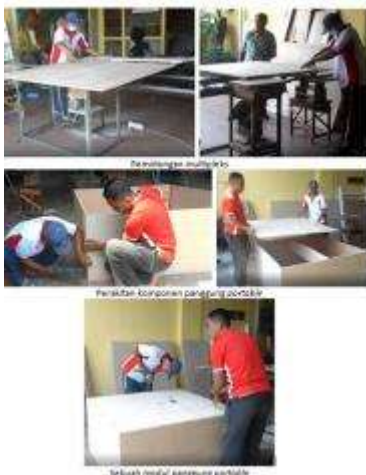
Gambar 9. Pembuatan Panggung Portable (2 minggu)

Panggung dibuat dari bahan multipleks 18 mm, dirancang untuk bisa dibongkar pasang secara portable. Terdiri dari 30 modul, masing-masing berukuran 120x120x60 cm.