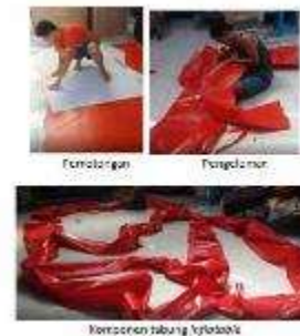
Gambar 11. Pembuatan Prototip Atap Panggung Tiup (2 minggu)

Urutan pembuatan adalah sebagai berikut: a) penyiapan bahan kain tarpaulin lapis PVC, b) pemotongan, c) pengelaman, d) perakitan tabung tiup, e) pemasangan penutup atap.