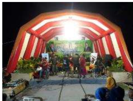
Gambar 3. Gerakan Membangun Desa, Agustus 2019