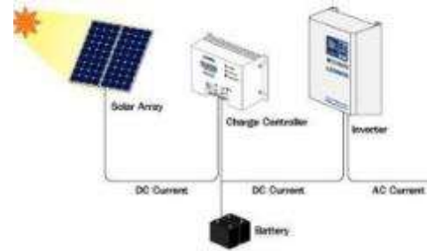
Gambar 6. Sistem Energi Surya Fotovoltaik

Komponen utama suatu Sistem Energi Surya Fotovoltaik adalah sel fotovoltaik yang mengubah penyinaran/radiasi matahari menjadi listrik secara langsung (direct conversion) yang ditangkap oleh Solar Array , diperlukan Balance of System (BOS) meliputi charge controller dan inverter , unit penyimpanan energi ( battery ) dan peralatan penunjang lain (Gambar 5). Sistem energi ini akan menunjang kebutuhan listrik blower sebagai sumber udara pada struktur pneumatik air inflated atap panggung.