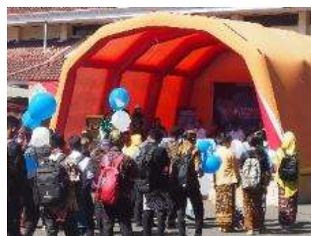
Gambar 4. Gerakan Anti Narkoba ITN, September 2019