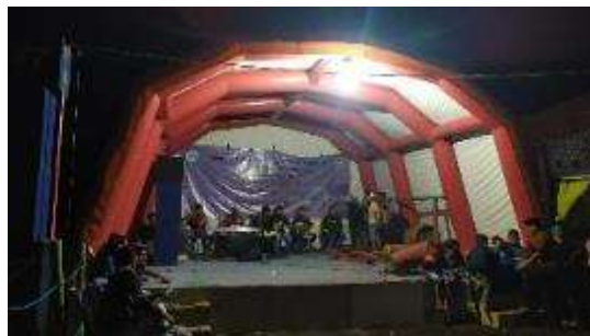
Gambar 2. Penutupan KKN, Agustus 2019