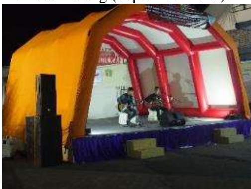
Gambar 1. Parade Handicraft, Juli 2019

Pelaksanaan penelitian dilakukan di Laboratorium bahan dan di lapangan. Pengujian bahan membran berupa uji kekuatan kain tarpaulin PVC kain pararsit dilaksanakan di Laboratorium Tekstil Universitas Islam Indonesia Yogyakarta, sedangkan pengujian penggunaan atap panggung tiup dilaksanakan pada beberapa tempat, yaitu: 1) Parade Handicraft di Halaman Skodam Kota Malang (Juli 2019); 2) Panggung Penutupan KKN Mahasiswa dan Panggung Gerakan Membangun Desa di Kampung Bunga Grangsil, Desa Jambangan, Dampit, Kab. Malang (Agustus 2019); 3) Panggung Gerakan Anti Narkoba di ITN Kota Malang (September 2019).