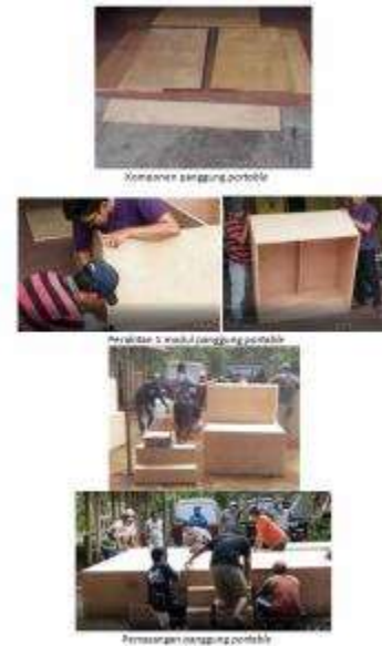
Gambar 10. Perakitan Panggung Portable (50 menit)