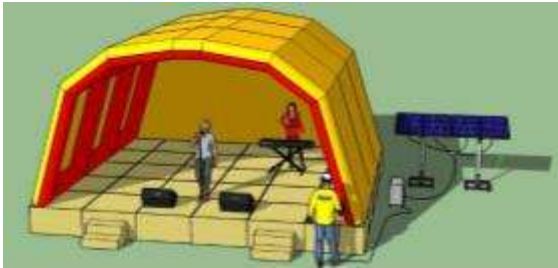
Gambar 8. Desain Atap Panggung Struktur Pneumatik Tium Energi Surya

Gambar berikut memperlihatkan desain atap panggung yang menggunakan struktur pneumatic dengan energi mandiri fotovoltaiik.