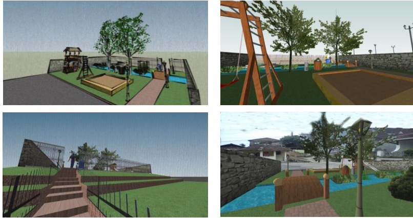
Gambar 6. Rekomendasi desain ruang terbuka public di Kelurahan Samaan RW 05