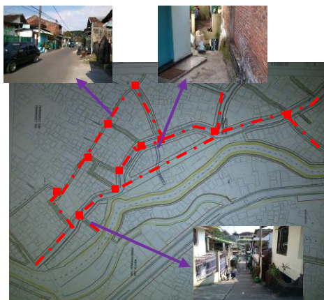
Gambar 2. Jalur sirkulasi di Kelurahan Samaan RW 05

Untuk sirkulasi di daerah permukiman RW 05 ini merupakan jalan kecil atau gang. Memiliki rentang lebar jalan sekitar 1 m – 2 m. Jalan berupa perkerasan semen dan paving stone. Pencapaian menuju lokasi penelitian ada Tiga yaitu pertama dari arah Kelurahan Lowokwaru dari arah Barat, kedua dari arah Kelurahan Penanggungan melalui jembatan, dan yang ketiga yaitu, dari arah Kuburan Samaan dari arah Timur.