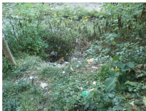
Gambar 5. Kondisi eksisting potensi ruang publik

Ada 4 potensi untuk memperbaiki dan menambah ruang publik di RW 5 Kelurahan Samaan ini, yang pertama adalah di tepi sungai di dekat RW 1. Daerah ini berupa cekungan dan anak-anak senang bermain di daerah tersebut, namun daerah ini adalah daerah dekat tepi sungai dan berpotensi banjir. Sehingga mungkin tempat ini hanya akan jadi Ruang Terbuka Hijau. Yang kedua adalah di RT 9, potensi ruang publik di daerah ini yaitu berupa tanah kosong, namun lahan ini hak kepemilikan individu, sehingga untuk membangun ruang publik disini cukup sulit. Yang ketiga adalah di dekat RT 7, lahan ini berupa ruang terbuka hijau yang banyak dirumbuhi pohon, namun lahan ini di pagar kawat berduri sehingga untuk pembebasan lahan cukup sulit. Yang terakhir adalah di dekat tepi sungai di RT 6, di daerah ini ruang terbuka yang tersedia cukup luas, dan potensi untuk membuat ruang bermain anak disini cukup bagus, karena disini banyak anak kecil bermain di pinggir jalan.