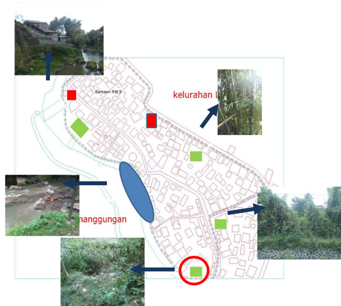
Gambar 4. Persebaran potensi ruang publik di RW 5 Kelurahan Samaan

Ada 4 potensi untuk memperbaiki dan menambah ruang publik di RW 5 Kelurahan Samaan ini, yang pertama adalah di tepi sungai di dekat RW 1. Daerah ini berupa cekungan dan anak-anak senang bermain di daerah tersebut, namun daerah ini adalah daerah dekat tepi sungai dan berpotensi banjir. Sehingga mungkin tempat ini hanya akan jadi Ruang Terbuka Hijau. Yang kedua adalah di RT 9, potensi ruang publik di daerah ini yaitu berupa tanah kosong, namun lahan ini hak kepemilikan individu, sehingga untuk membangun ruang publik disini cukup sulit. Yang ketiga adalah di dekat RT 7, lahan ini berupa ruang terbuka hijau yang banyak dirumbuhi pohon, namun lahan ini di pagar kawat berduri sehingga untuk pembebasan lahan cukup sulit. Yang terakhir adalah di dekat tepi sungai di RT 6, di daerah ini ruang terbuka yang tersedia cukup luas, dan potensi untuk membuat ruang bermain anak disini cukup bagus, karena disini banyak anak kecil bermain di pinggir jalan.