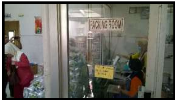
Gambar 8. Ruang Pengepakan