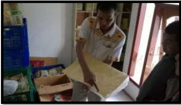
Gambar 6. Karton Bahan Kemasan Produk