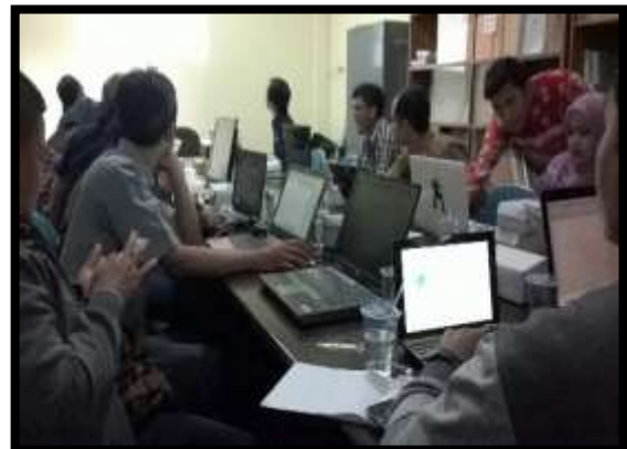
Gambar 12. Peserta Pelatihan Pembuatan Desain Kemasan Hari Pertama