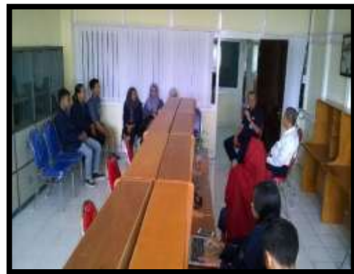
Gambar 11. Monitoring Program Kewirausahaan