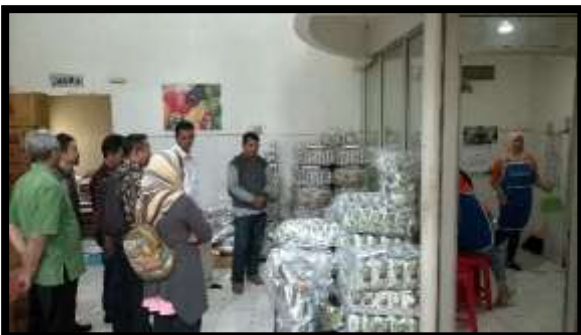
Gambar 9. Finished Good Product

Pelatihan desain kemasan produk yang dilakukan ini sangat bermanfaat dan berdampak positif bagi masyarakat, dalam hal ini Usaha Mikro, Kecil dan Menengah (UMKM) bidang kerajinan, kuliner dan keluarga yang tergabung dalam kelompok Posdaya. Peserta pelatihan sangat antusias mengikuti tahapan demi tahapan pelatihan yang diberikan oleh instruktur yang memiliki kompetensi di bidang tersebut.