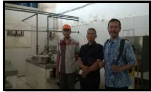
Gambar 10. Instruktur, Ketua APKM dan Ka. Pusat Kewirausahaan LPPM