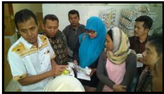
Gambar 7. Kemasan Produk Cacat