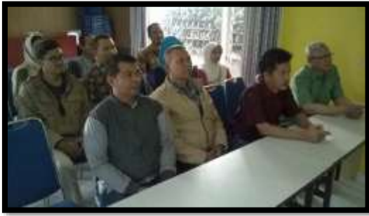
Gambar 13. Peserta Praktek Pembuatan Kemasan Produk Hari Kedua

Bagi UMKM bidang kerajinan dan kuliner, manfaat pelatihan sangat terasa karena para pelaku usaha di bidang ini dapat membuat berbagai alternatif desain untuk kemasan produknya, sehingga tampilan produknya lebih variatif, menarik ( eye catching ), namun masih tetap terjaga kualitas produknya. Sedangkan bagi kelompok Posdaya, pelatihan ini dapat menjadi inspirasi dan motivasi dalam memanfaatkan segala potensi yang ada di lingkungan sekitarnya.