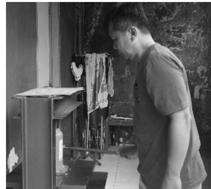
Gambar 4: Peralatan Plong Kertas/Karton Tenaga Dongkrak

Dalam mengatasi masalah kecepatan produksi dilakukan dengan pembuatan 1 buah alat plong kertas dan karton bertenaga dongkrak serta pembinaan operasional peralatan plong kertas selama 1 minggu. Dampaknya terlihat dari jumlah produk 100 buah gift box yang semula memerlukan waktu 7 hari dengan alat plong kertas/karton bertenaga dongkrak dapat diselesaikan dalam waktu 3 hari sehingga meningkatkan produktivitas lebih dari 2 (dua) kali dibandingkan produksi secara manual.