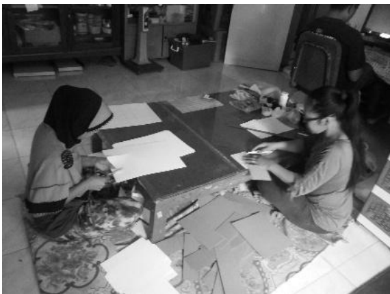
Gambar 3: Pemotongan Secara Manual