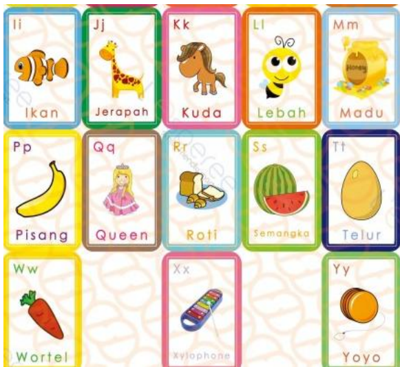
Gambar 1. Kartu Huruf dan Kata

pemahaman makna kata. Media ajar yang digunakan mampu menarik perhatian anak-anak untuk mengikuti pembelajaran bahasa Indonesia. Bentuk, warna, dan gambar di desain menarik agar peserta tidak bosan, selain itu tim menyampaikan dengan menyenangkan. Dari media yang dipakai bukan hanya menarik perhatian anak-anak down syndrome , tetapi anak-anak lainnya juga meskipun tidak termasuk dalam kriteria dari tim.