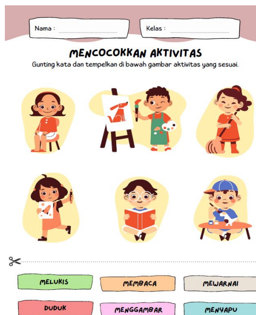
Gambar 3. Mencocokkan Aktivitas